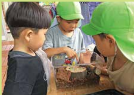
『夏はクワガタムシを観察しました』

カエルやバッタ、ダンゴムシ、季節の虫達など、小さな生き物と触れ合う機会がたくさんある久万こども園で、命あるものを労わり、大切に育んでいきたいと思っています。