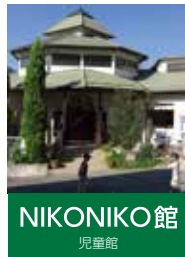
NIKONIKO 館 児童館

〒791-1201 愛媛県上浮穴郡 久万高原町久万1444-5 TEL:0892-21-3192 FAX:0892-21-3191 sien@ikuwa.or.jp