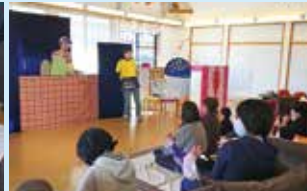
『おたごみまんの人形劇』