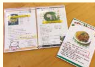
『簡単手作りおやつレシピ』