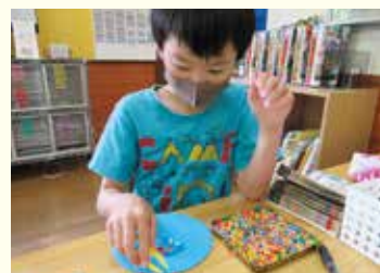
『アイロンビーズを作ってます』