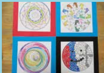
『個性的な出来上がり』