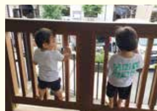
『お子さんの健やかな成長を願って』