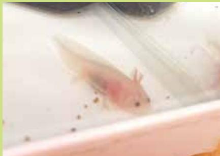
『少しずつ大きくなってきました』

7月から4歳児の部屋でウーパールーパーを飼い始めました。子ども達は餌を食べながらすくすく大きくなっていくウーパールーパーに興味津々。毎日1回は水槽を見に行き、「あ！泳いだ。」「大きくなってる!」と動く姿や泳ぐ姿を楽しそうに観察しています。