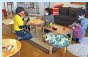
『ワークショップの様子』