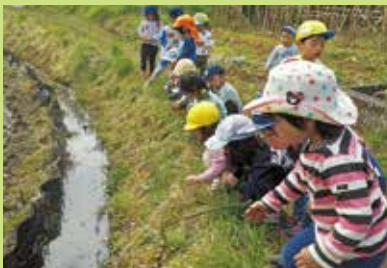
『魚釣りを楽しもう』