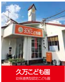
久万こども園 幼保連携型認定こども園

毎年、小学校からの幼馴染とプレゼント交換をしているのですが、昨年マリメッコのお店で、マグカップとお皿を買ってプレゼントしました。有名ブランドが買えるくらい大人になったんだなあと感じました。今年は何をプレゼントしようかな？