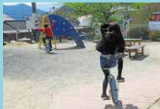
『長い距離にも挑戦』