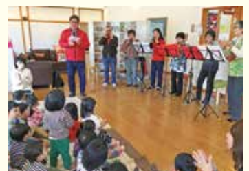
『オカリナグループ「おくまさん」と「ほっど雪ゆけ」の皆さん』