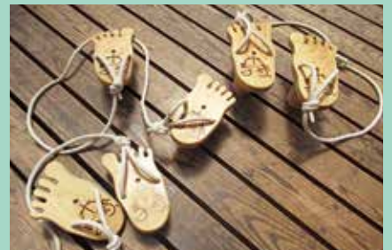
『木馬育(もくばいく)』

昔ながらの竹ぼっくりと似ている木馬育。低・中・高、三種類の高さの違う下駄の上に立ち、前進します。高い下駄は立ち上がるだけでも一苦労。バランス感覚が養われ、裸足の足裏に心地よい刺激と木のぬくもりが伝わる木育としても注目のおもちゃです。