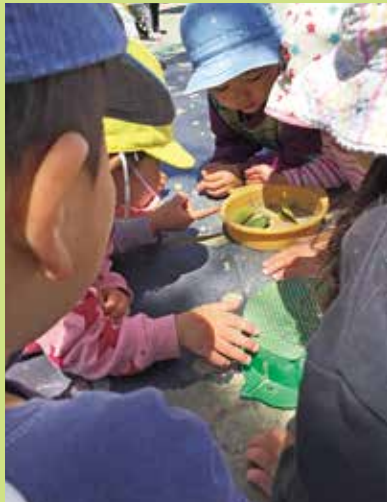
『大きが大きがえろを見つけろよ』