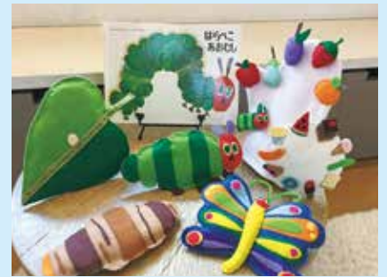
『はらぺこあおむし』