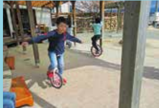
『手を離して・・・』