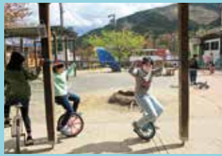
『まずはロープを持って』

天気の良い日には、戸外で遊ぶのが大好きな子どもたちです。砂場で遊んだり鬼ごっこをしたり、体を動かして元気いっぱい遊んでいます。中でも一番人気なのが一輪車です。バランスをとるのが難しい一輪車ですが、すいすい乗ることができる友達の乗り方を観察し、フェンスやロープ、スタッフの手を持って練習しました。ギュッと力を入れて握っていた手も、少しずつ力が抜け、一人で前に進めるようになってきました。1年生も、お兄ちゃんお姉ちゃんたちのまねをして、練習を始めています。