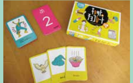
『キャット&チョコレート』

アイテムカードを3枚づつ配ります。日常のちょっとしたアクシデントが書かれたお題カードを一枚めくり、その問題をアイテムカードを使って解決していきます。ひらめきと思考力、そして説明する力が試される新感覚カードゲーム。高学年や大人にもおすすめです。