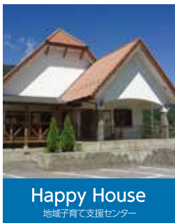
Happy House 地域子育て支援センター

〒791-1201 愛媛県上浮穴郡久万高原町久万 1447 TEL:0892-21-0777 FAX:0892-21-0772 hoiku@ikuwa.or.jp