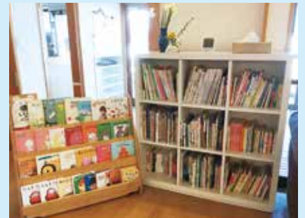
『貸し出しできます』