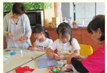
『こっとな・コットン』

興味のある方は、NIKO NIKO 館(TEL 0892-21-2335 担当:渡部)までお問い合わせ下さい。