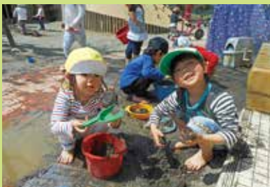
『裸足になると気持ちいいね』