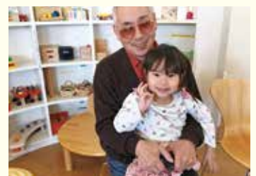
『演奏のあと、抱っこしてもうってごきげん!』