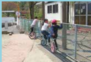
『疲れたりひと休み』